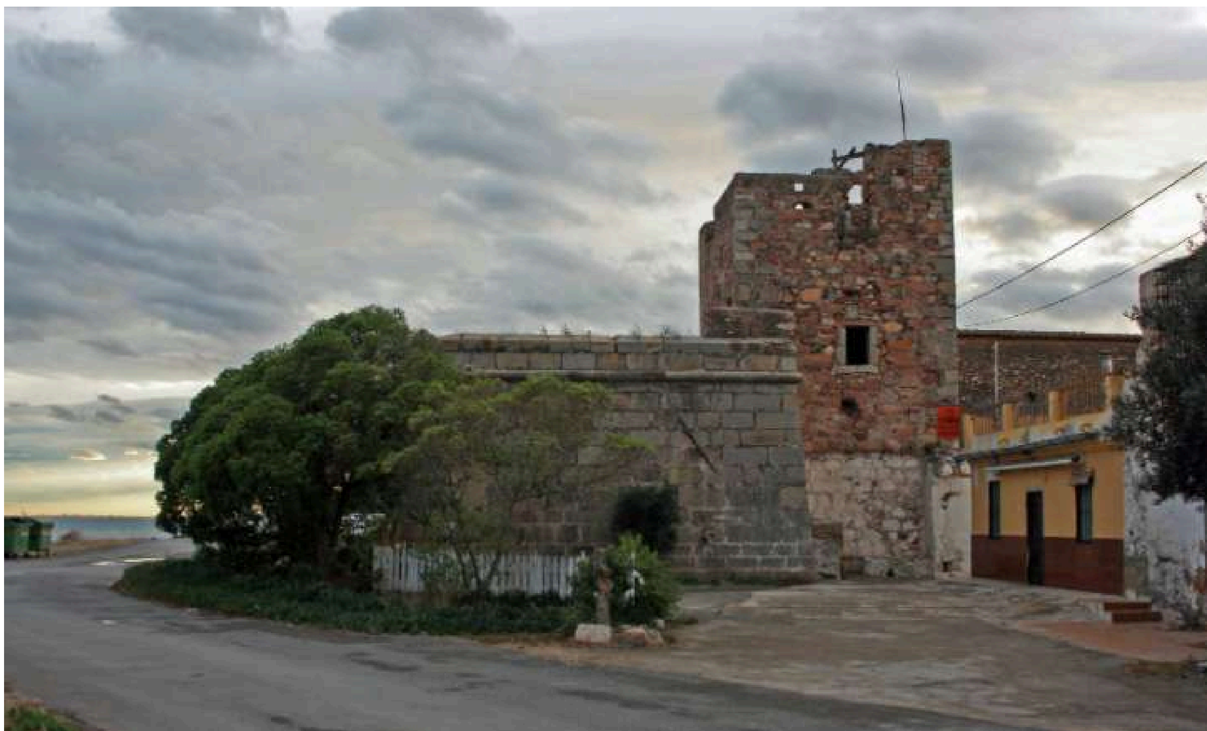
EL GRAU VELL