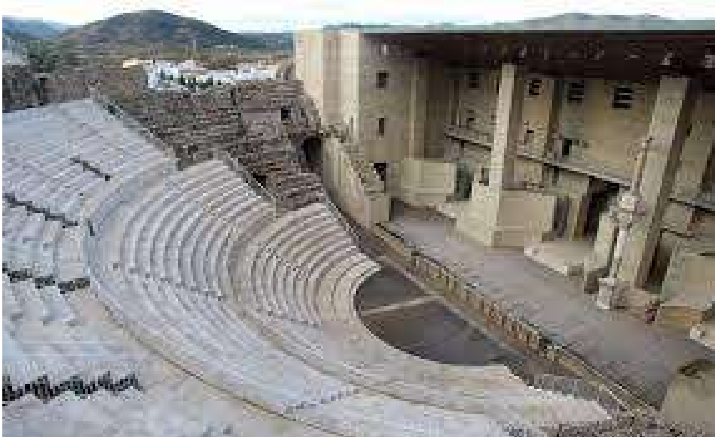
TEATRO ROMANO DE SAGUNTO